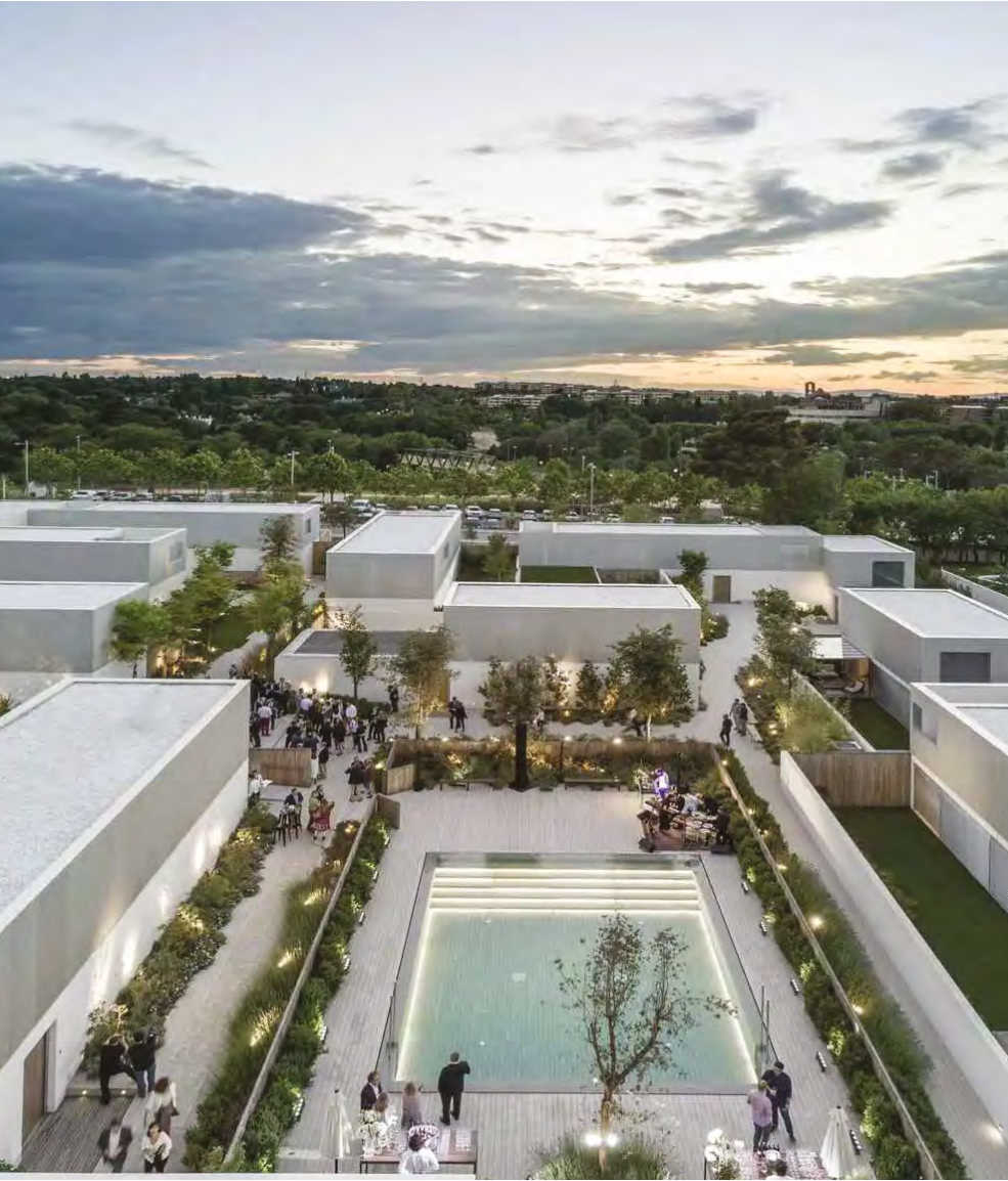
Acima, o condomínio Somosaguas, em Madri; ao lado, o átrio emblemático do Einstein